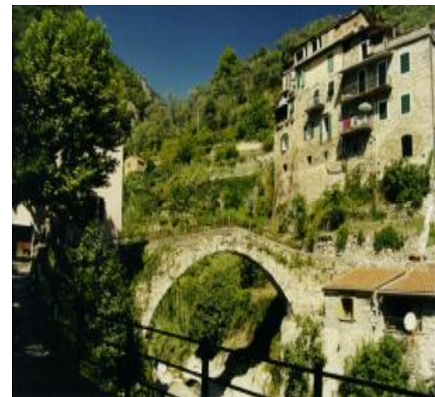
Rocchetta Nervina– Ponte Vecchio